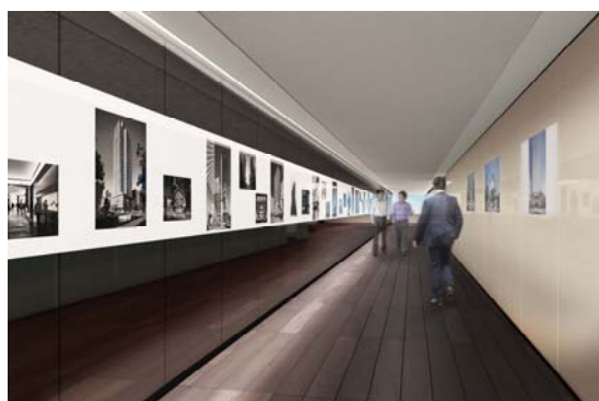
エントランスギャラリー