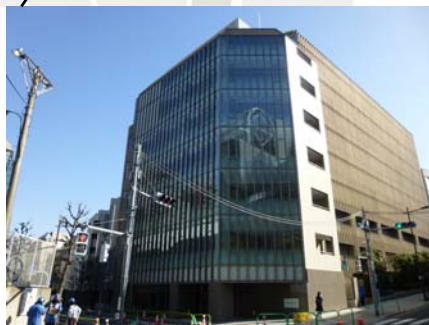
大妻女子大学別館