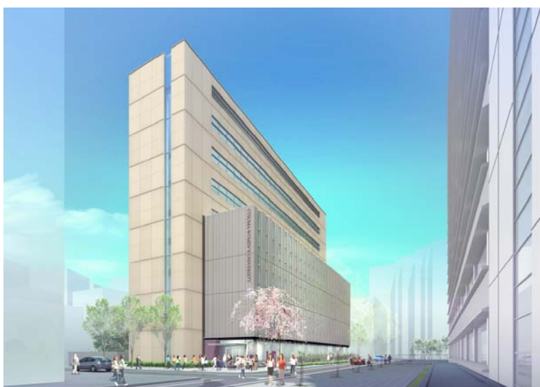
▲「大妻女子大学H棟校舎」完成予想CG (現時点のイメージであり、今後変更の可能性あります)

また、本計画のほか、「大妻学院本館」の再開発において三菱地所が再開発のプロジェクトマネジメント支援と、三菱地所設計がコンストラクションマネジメント業務(以下、「CM業務」)を、「大妻女子大学校舎棟」改修および「大妻女子大学別館」建替において三菱地所設計がCM業務を、「大妻久我山寮」において三菱地所レジデンス株式会社が開発、三菱地所設計が設計監理業務を実施。三菱地所グループは、私学運営の各側面から不動産ソリューションを提供しています。