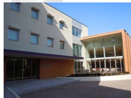
大妻久我山寮 (東京都世田谷区)