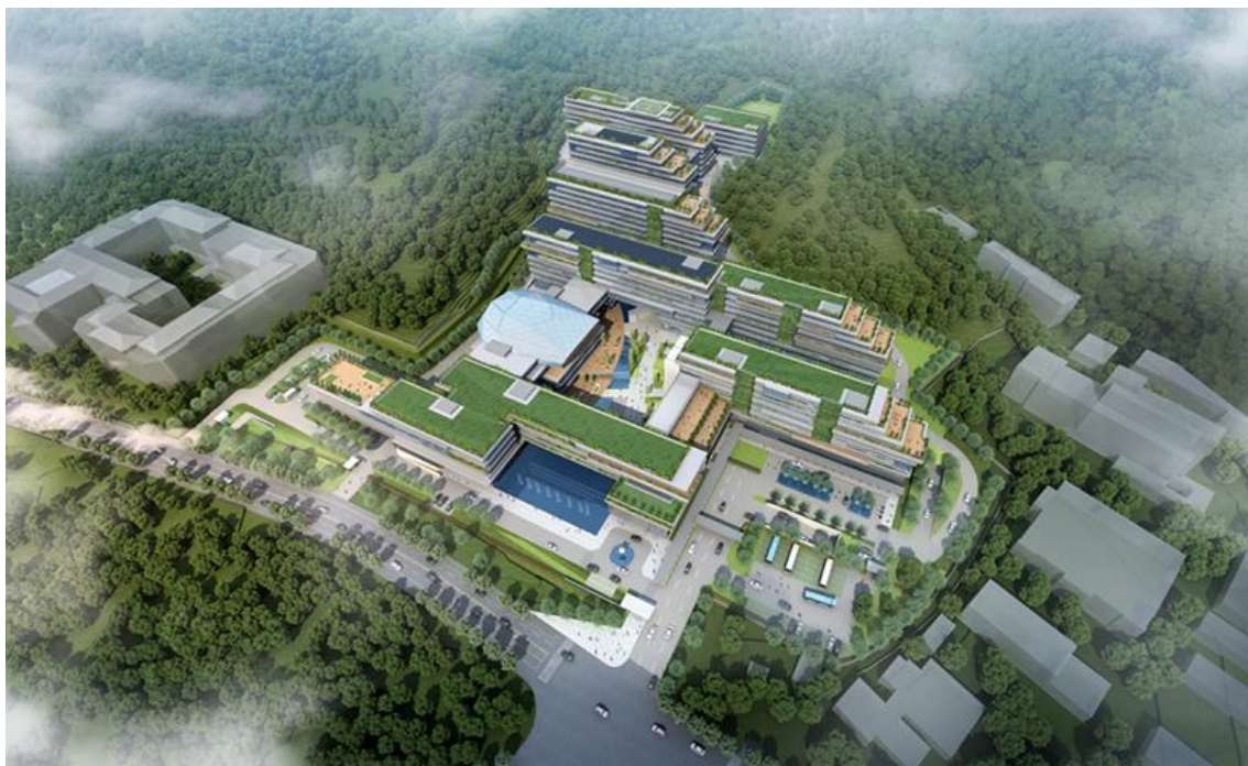
方案設計時の鳥瞰パース

株式会社三菱地所設計（所在地：東京都千代田区、取締役社長：大内政男）は、このほど中国インターネット金融最大手・アリ金融サービスグループ（以下、アリ金融）各社が入る大型総合本社ビル建設プロジェクトを受注しましたのでお知らせします。