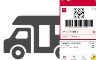
キッチンカーでの「d払い」体験