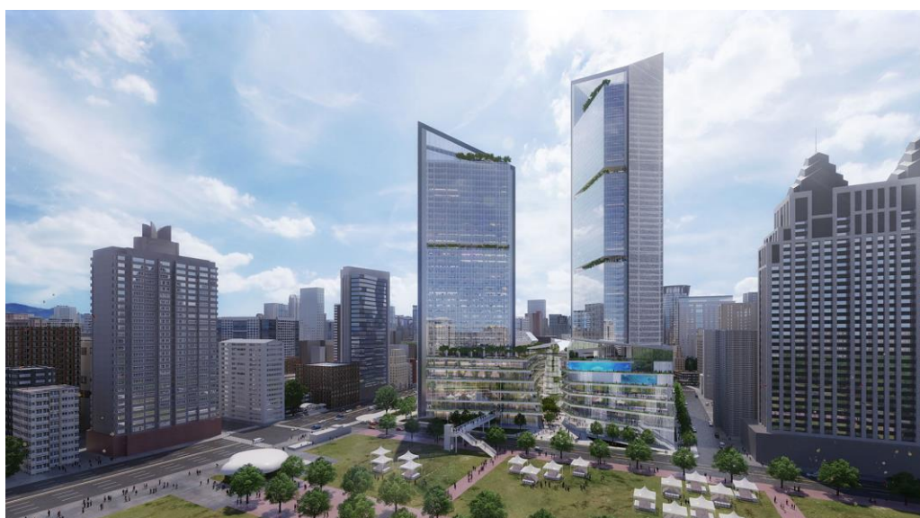
北向外觀：右側為辦公棟、左側為旅館棟。前方為綠帶公園示意（設計提案階段概念圖）

株式会社三菱地所設計（所在地：東京都千代田區、代表董事社長：林 総一郎）本次確定承接位於臺灣南部主要大城高雄市，為南台灣最大規模的地上權案--「高雄捷運凹子底站旁開發案」建築設計業務，特此公告。