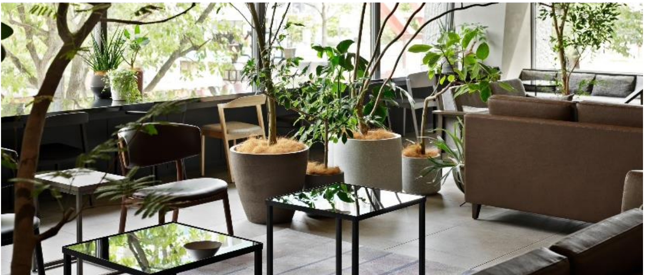
▲CANVAS ラウンジ「KOKAGE」(イメージ)。気に入った家具や植栽は購入することも。

また、北海道産プロダクトや食材のマルシェ(農園直売会や、道産ワイン試飲会・道産チーズ試食会、株式会社積丹スピリットによる“積丹ジン”講演会)など、地元の方も思わず足を運びたいくなる「北海道を体感する」イベントも開催を予定しております。