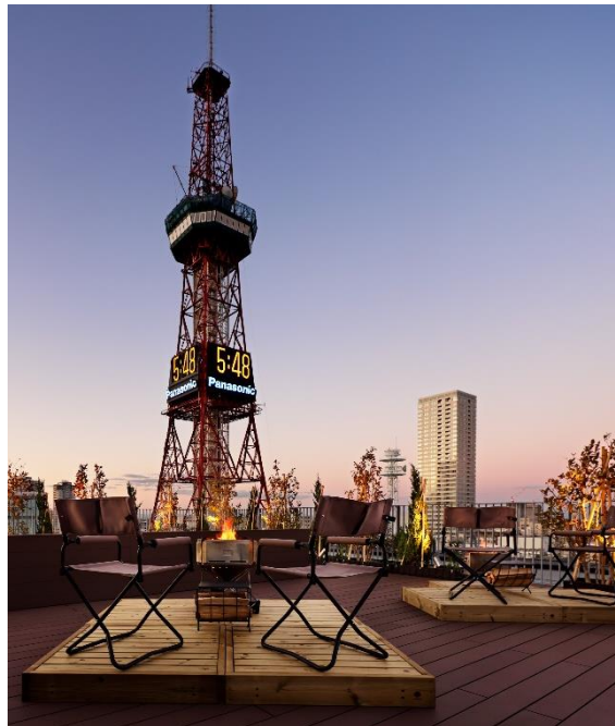
▲さっぽろテレビ塔を臨むルーフトップでここだけの体験を