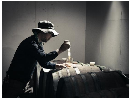
▲「ドメーヌ・タカヒコ」のワインを自慢の料理とご一緒に