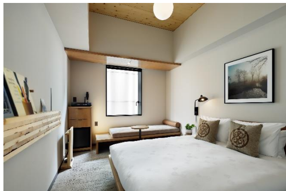
▲ギャラリーフロア スーペリアダブル パークビュー(23.5㎡)

天井から釣り下がるランプは、大通公園の街灯と同じガラスグローブ球のデザイン。室内にしながら、札幌を感じる事が出来るお部屋です。また、3~6階は北海道産トドマツを使った木の天井のため、より「木のぬくもり」を感じながらお過ごしいただけます。