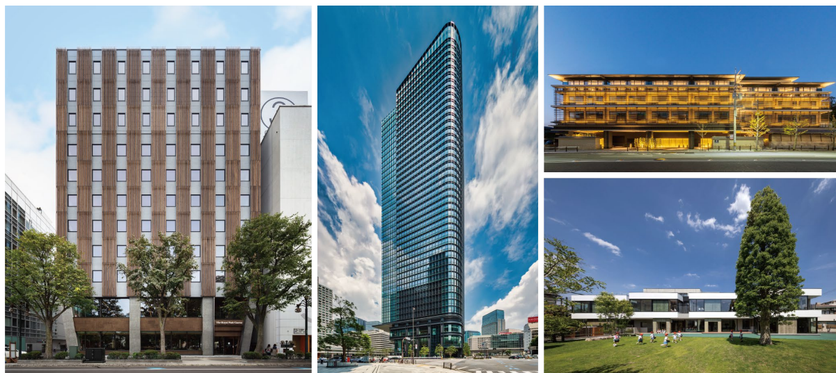
左：ザ ロイヤルパーク キャンパス 札幌大通公園／中央：TOKYO TORCH 常盤橋タワー 右上：ホテルオークラ京都 岡崎別邸／右下：成徳幼稚園

株式会社三菱地所設計（所在地：東京都千代田区、代表取締役社長：谷澤 淳一）は、当社が設計を手掛けた下記の4つのプロジェクトが「iF Design Award 2023」（Architecture 部門）を受賞したことをお知らせします。