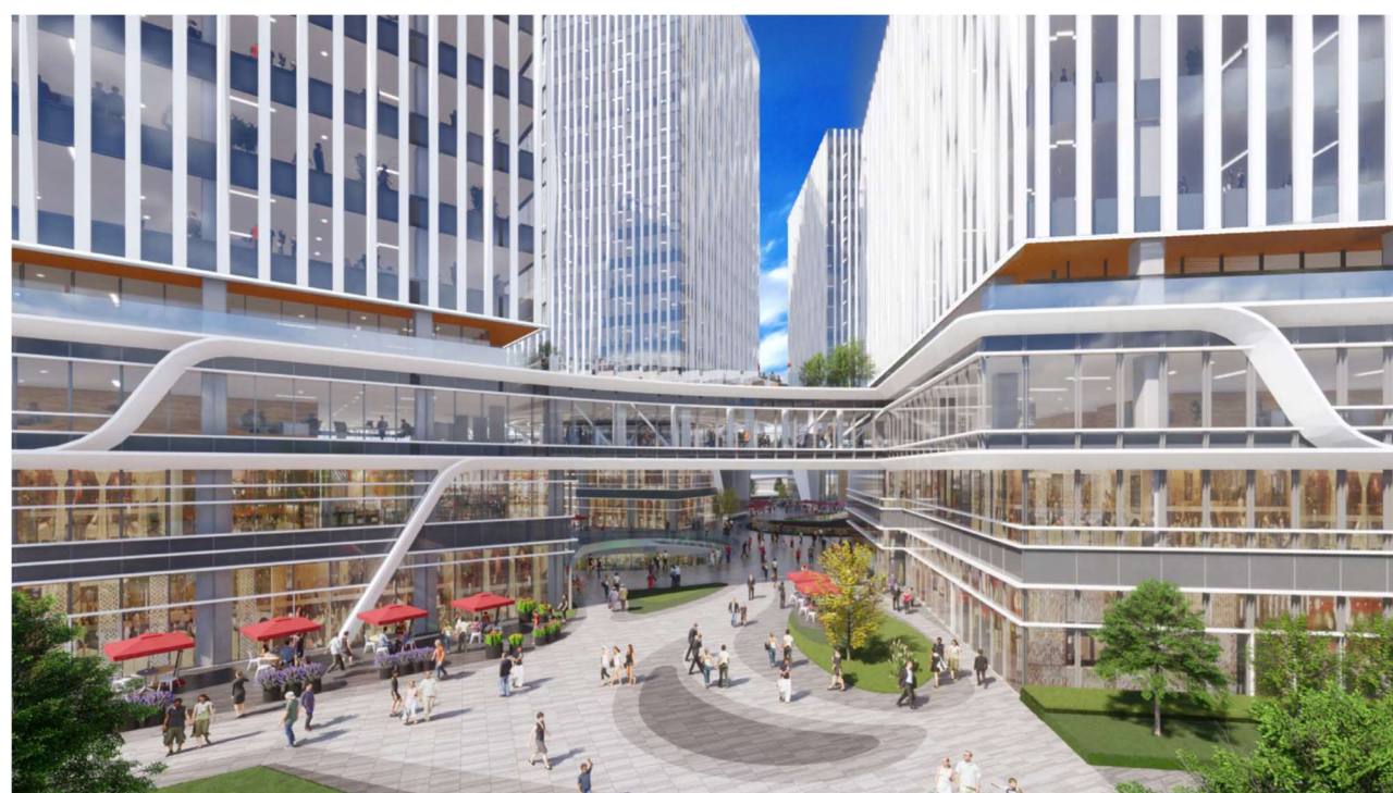
▲ 完成后的外观形象（开放空间设计，鼓励游客的流通）