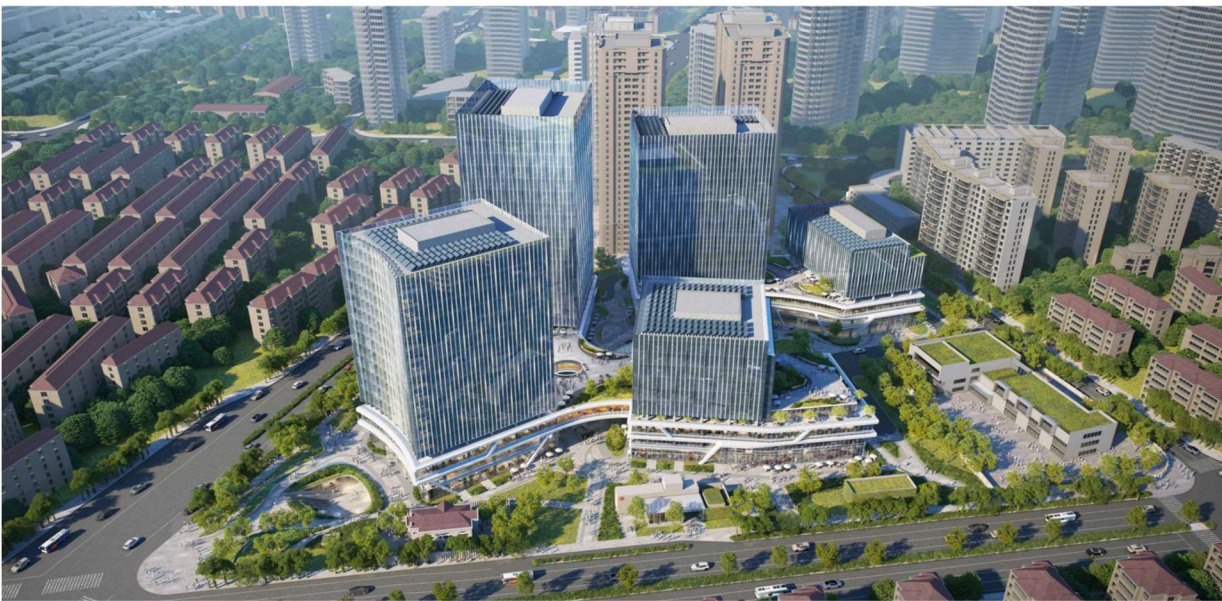
▲ 项目完成后的形象