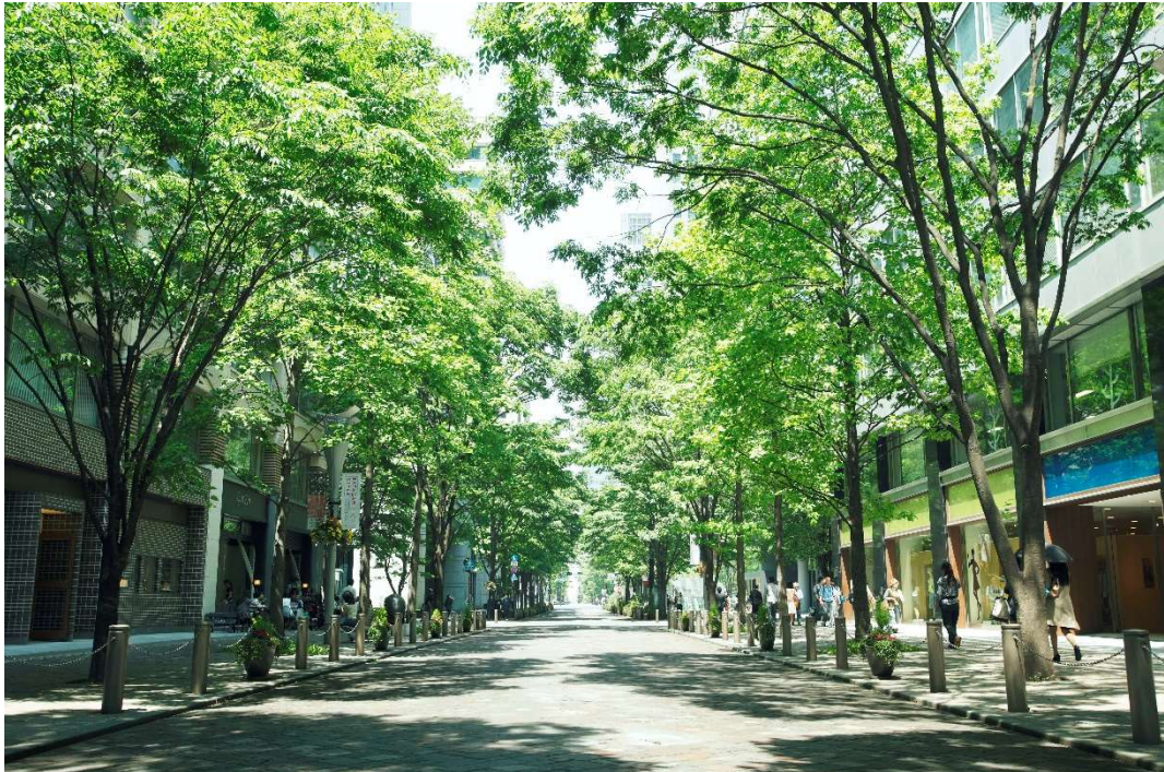
<东京丸之内仲大道>