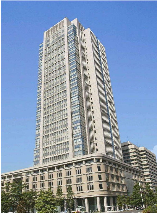
<东京丸之内・丸之内大厦>