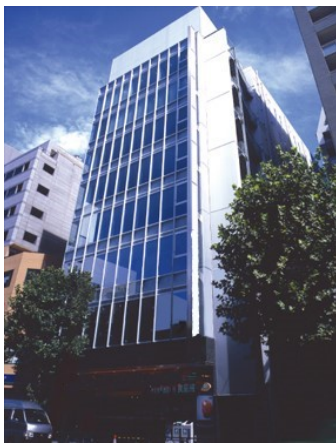
▲JRE東五反田一丁目ビル

ジャパンリアルエステイト投資法人は、保有する「JRE東五反田一丁目ビル」（東京都品川区）において2021年3月にZEB Ready ※2 を取得し、エネルギー消費量削減に向けた積極的な取り組みを推進しています。その取り組みの一環として、株式会社三菱地所設計を設計・監理者とし、ZEB化改修工事を実施しました。本改修に際し、高効率機器の導入のみならず、使用実態に基づく空調容量の最適化（サイズダウン）を実施した点、詳細な実態調査や事前検証による改修効果の「見える化」を行った点が高く評価され、今般、奨励賞の受賞に至りました。