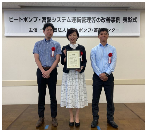
▲2024年7月22日 授賞式の様子

本改修は、わが国が目指す2050年のカーボンニュートラル社会の実現に沿った「既存ビルの省エネ化」の取り組みです。今後もジャパンリアルエステイト投資法人と株式会社三菱地所設計はサステナビリティに配慮した改修工事を実施してまいります。