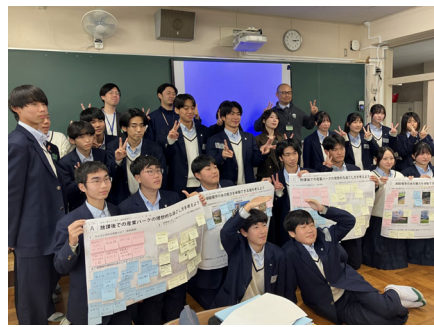
「御殿場の水の魅力を体験できる場」「放課後の産業パークでの理想的な過ごし方」をテーマにしたワークショップ。